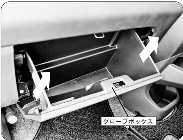
グローブボックス

グローブボックスを開いて、グローブボックスの両サイドを片側ずつ矢印方向(手前方向)に引くようにしてグローブボックス下の噛み合わせ部分(左右各1箇所)を外してグローブボックスを取り外します。 パネルやグローブボックスの破損等にご注意ください。