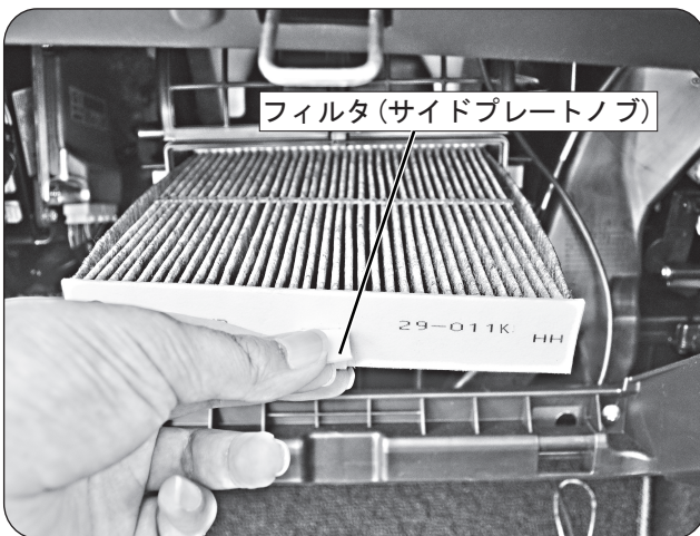
フィルタ(サイドプレートノブ)