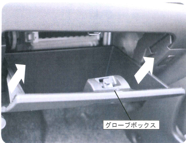
グローブボックス

グローブボックスを開いて、グローブボックスの両サイドを片側ずつ(右側から)矢印方向(手前方向)に引くようにしてグローブボックス下の噛み合わせ部分(左右各1箇所)を外してグローブボックスを取り外します。 パネルやグローブボックスの破損等にご注意ください。